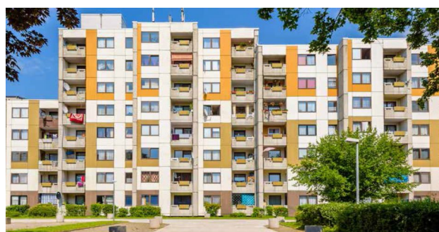
Münsterstrasse 200-204, Dortmund

comprenant 317 appartements de 70 m 2 en moyenne. Le centre-ville de Francfort est accessible en 30 minutes environ par les transports en commun.