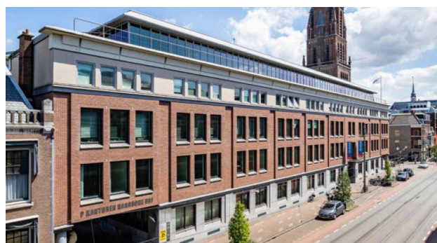
Parkstraat 83, La Haye

Afin de soutenir la croissance du fonds, une nouvelle augmentation du capital est prévue à l'été 2020.