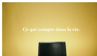
Ce qui compte dans la vie